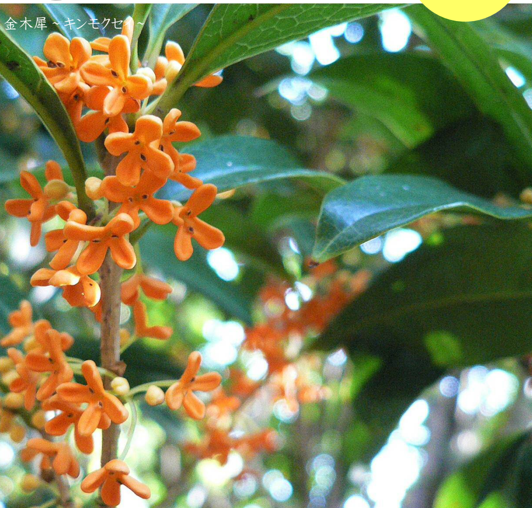
金木犀 ~ キンモクセイ ~